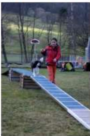
Planche sur tonneau: le chien passe sur la planche et s'arrête au milieu 5 secondes.

Passerelle: le chien passe la passerelle en marquant un arrêt bref au milieu.